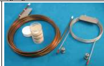
INNOSteel-Rohr (links) 1/8" AD x 2,1 mm ID Mikrogepackte Säule (rechts) 1/16" AD x 1,0 mm ID